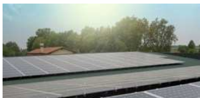
Nuovo impianto fotovoltaico da 104 Kwh Cantina di Vinificazione a Fossalta di Piave

Quest'anno l'andamento climatico e meteorico è stato inusuale, ma favorevole alla vite, permettendogli un ciclo vegetativo più razionale, con una maturazione diluita nel tempo che ha determinato lo sviluppo di acini più ricchi ed equilibrati.