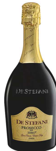
Nuova bottiglia Prosecco Zero Millesimato Extra Dry

La vendemmia 2013 ha registrato una produzione quantitativamente nella media degli ultimi 5 anni.